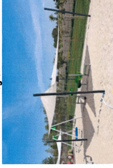
Piaskownica z "kuchnią błotną", zabezpieczona przeciwfonicznym żagłem