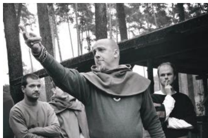
Kolejna edycja Civitas Sari przeszła do historii

Wydarzenie organizowane było przy współpracy Kurkowego Bractwa Strzeleckiego,