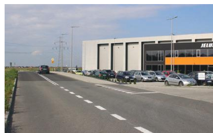
Nowa droga do strefy w Osinach

dojazd do następnych terenów inwestycyjnych. ◀