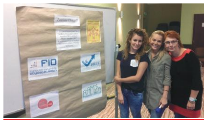
Odnowiona siedziba