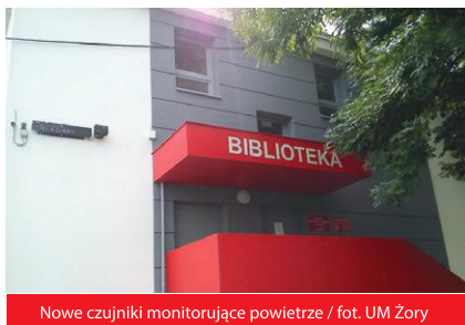
Nowe czujniki monitorujące powietrze

Dziesięć czujników wskaźnikowych marki Beskid Instruments model BI-PRO-0, czyli laserowych urządzeń pomiarowych PM10 i PM