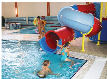
Nowe atrakcje żorskiego basenu

Park Wodny niedawno został odświeżony, a zmiany przeszły m.in. sauna na podczerwień