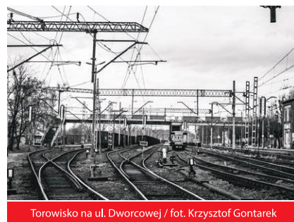
Torowisko na ul. Dworcowej

prac, wiążącego się również z kilkudniowym zamknięciem przejazdu ruchu kołowego na ul. Dworcowej. O utrudnieniach i zmianach w ruchu będziemy informowali mieszkańców z odpowiednim wyprzedzeniem. ◀