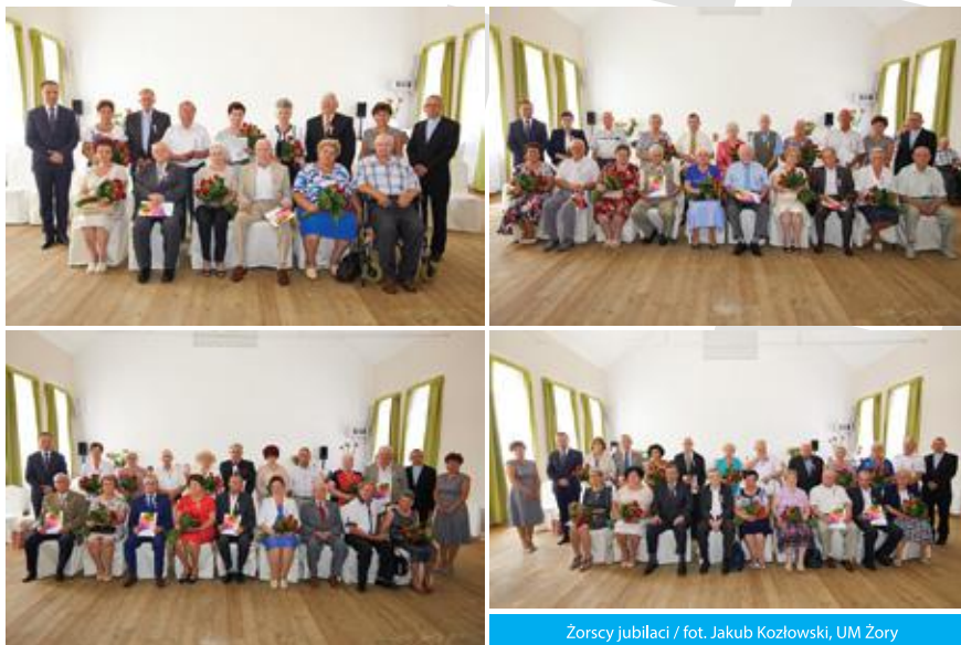
Żorscy jubilaci

Szanownym jubilatom gratulujemy pięknej rocznicy i życzymy kolejnych szczęśliwych lat przeżytych w zdrowiu, radości i szczęściu. ◀