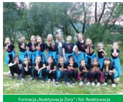
Formacja „Reaktywacja Żory”

Organizatorem wyjazdu było Stowarzyszenie Formacja Taneczna Reaktywacja Żory. Projekt został dofinansowany ze środków Gminy Miejskiej Żory. ◀