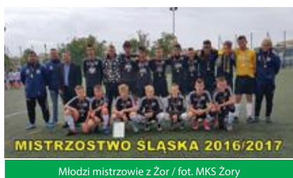
Młodzi mistrzowie z Żor / fot. MKS Żory

Dzięki wywalczeniu już po raz drugi z rzędu Mistrzostwa Śląska drużyna MKS Żory uzyskała awans do Centralnej Ligi Juniorów, w której