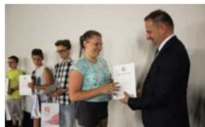
Prezydent nagroził proekologiczne działania

sztuk; klasa IIA w SP 8 w Zespole Szkolno-Przedszkolnym nr 8 w Żorach - 2026 sztuk oraz klasa V w SP 6 w Zespole Szkolno-Przedszkolnym nr 6 w Żorach - 2007 sztuk baterii. ◀