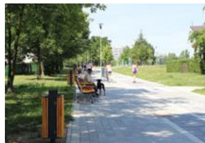
Deptak po remoncie

funkcjonalnych ławek, 6 koszy na śmieci oraz 14 stojaków rowerowych. Dzięki temu w naszym mieście powstała kolejna przestrzeń przyjazna mieszkańcom. ◀