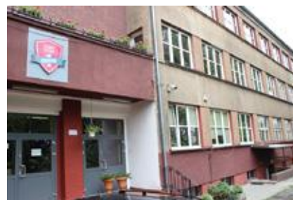
Zespół Szkół Ogólnokształcących