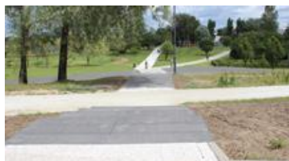
Nowe schody w Parku Cegielnia

Do Parku Cegielnia chętnie zaglądają Żorzanie zarówno z centrum miasta, jak i z jego dalszych zakątków. Tych, którzy wchodzą na teren parku od strony ulicy Wodzisławskiej z pewnością ucieszy fakt, że miasto wybudowało w tym miejscu nowe schody. Dzięki nim można zejść do Cegielni „na skróty” i nie trzeba korzystać z krętej ścieżki spacerowej. ◀