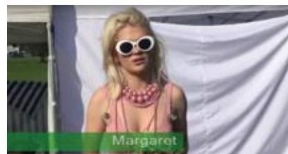
Kadr ze spotu promocyjnego G4

Zadanie pn. „Segregujemy i odzyskujemy!” było realizowane przez stowarzyszenie Grupa Działamy i współfinansowane ze środków Gminy Miejskiej Żory. ◀