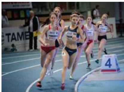
Żorscy lekkoatleci odnoszą sukcesy

W ramach inwestycji przy Zespole Szkół nr 6 powstanie pełnowymiarowy stadion lekkoatle-