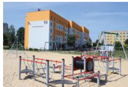
Nowe atrakcje na placu zabaw

w naszym mieście, który został w tym roku rozbudowany. Dzieci odwiedzające plac zabaw na os. Pawlikowskiego mogą od niedawna korzystać z huśtawki ważki. ◀