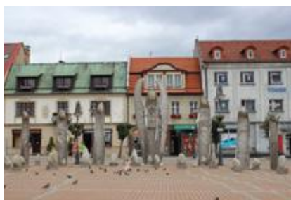
Wyjątkowe rzeźby przyciągają wzrok