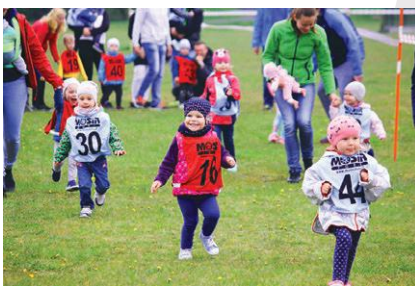
„Przedszkolaki i uczniaki na start”

Choć boule to dyscyplina sportu od niedawna obecna w Żorach, to grono jej sympatyków wciąż rośnie. W „II Otwartym Turnieju Gry w Boule” wystartowało 18 zawodników, rywalizujących na trzech boiskach. Zwyciężył Piotr Flaga przed