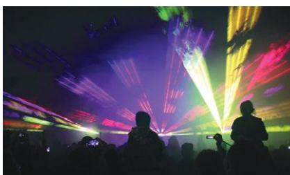
Laserowe widowisko