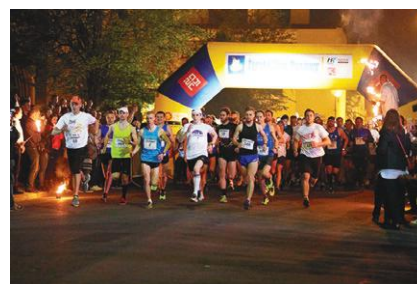
V Żorski Bieg Ogniovy wystartował