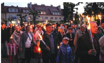
Uroczysta procesja