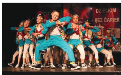
Festiwal „Dzieci dzieciom – bez barier”

Wydarzenie zorganizowane zostało przy wsparciu finansowym Urzędu Miasta Żory. ◀