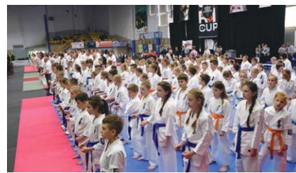
Trzecia edycja turnieju Karate Kyokushin