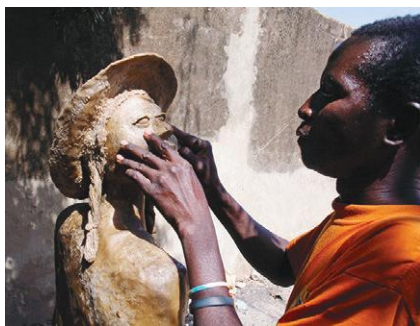
Posąg upamiętniający pisarkę

► Muzeum Miejskie w Żorach to miejsce, gdzie śląska tradycja przeplata się z kulturami całego świata – ze szczególnym uwzględnieniem Afryki. Już niedługo więzi naszego miasta z „Czarnym Łądem” podkreśli niezwykle pomnik, który stanie przed budynkiem muzeum. Upamiętniona zostanie nim Stefanie Zweig – związana z Żorami pisarka, autorka powieści „Nigdzie w Afryce”, która doczekała się oskarowej ekranizacji.