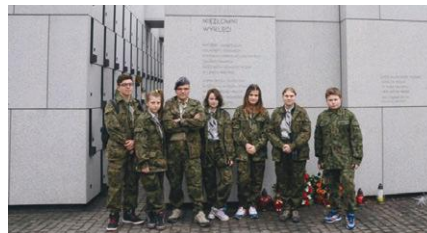
fot. 16 Drużyna Harcerska „Wataha” im. Żołnierzy Wyklętych

W związku z podejmowanymi działaniami na rzecz promowania historii Żołnierzy Wyklętych, 11 stycznia br. Komendant Hufca ZHP Żory przyznał 16 Drużynie Harcerskiej „Wataha” prawo używania imienia Żołnierzy Wyklętych. ◀