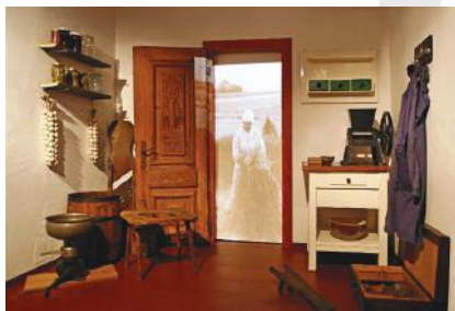
Komora, czyli domowa spiżarnia

Wystawę można oglądać na stronie naszatozsamosc.pl . Odzwierciedla ona problematykę wystawy stałej w żorskim muzeum,