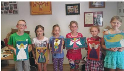
Warsztaty plastyczne

metodą quillingu, origami, bombki, stroiki, ikony anielskie na drewnie, szkatułki oraz ozdoby świąteczne. Dużą atrakcją był udział w zajęciach gości z Indii i Brazylii, którzy odwiedzili nasz kraj w ramach Światowych Dni Młodzieży i możliwości wspólnego wykonywania z nimi różnych prac.