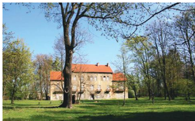
Zielen w parku znów będzie zachwycała gości

Prosimy, by w czasie prowadzenia prac unikać spacerów na terenie parku przypałacowego oraz zachować szczególną ostrożność przebywając na tym terenie. ◀