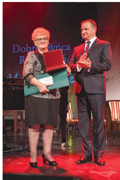
Dobroczyńca Roku 2016