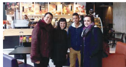
Wolontariusze / fot. MBP Żory

Szczegółowe informacje znajdują się na stronie internetowej www.mbpzory.pl oraz pod numer telefonu: 32 43 44 584. ◀