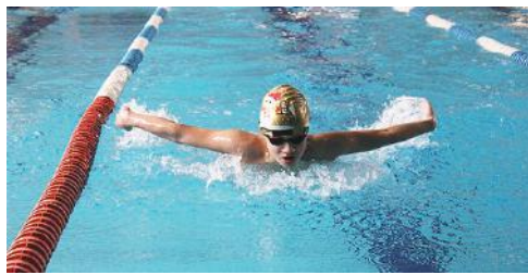
Młodzi pływacy zaprezentowali świetną formę