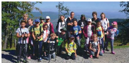
Wycieczka podopiecznych Świetlicy

► Już od ponad 20 lat pracownicy Świetlicy dla Dzieci „Horyzont” Miejskiego Ośrodka Pomocy Społecznej w Żorach pomagają dzieciom z całego miasta. Placówka działa przez cały rok i prowadzi autorski program wychowawczy pod nazwą „Wygrać siebie”.