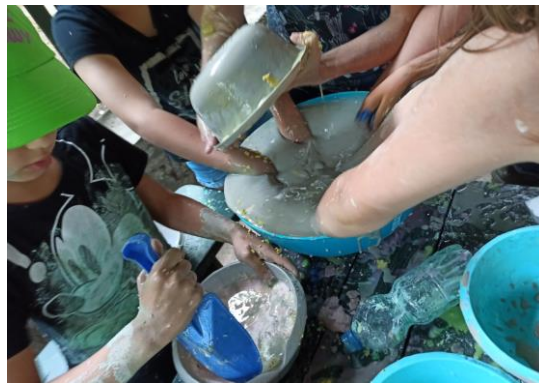
Cykl spacerów rodzinnych i pikników w lesie – lato 2020