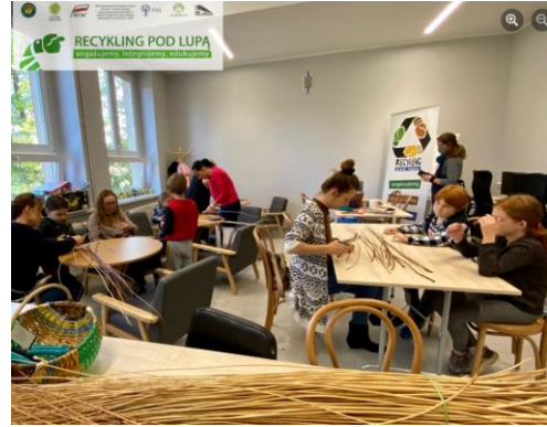
Warsztaty: „Woreczki z firanki – projekt Eco bags” w MBP na os. Pawlikowskiego oraz „Koszyki wyplatane z wikliny” w Świetlicy MOK Wodzisławska 300 w Roju