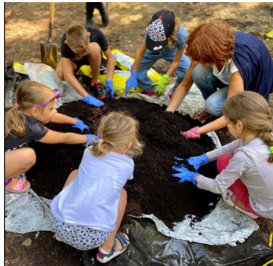
Szkolenie „Ekoliderzy: Robimy ogrody wertykalne” – Park Piaskownia i Świetlica MOK Wodzisławska 300 w Żorach-Roju