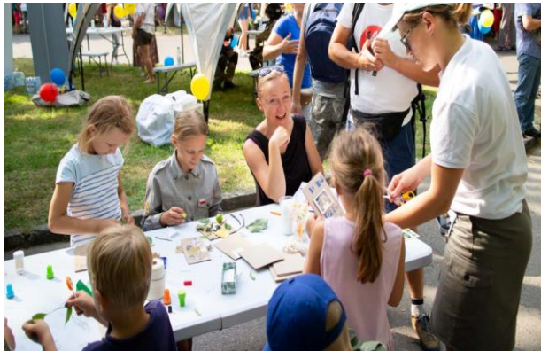
Piknik rodzinny w dzielnicy Ks. Władysława